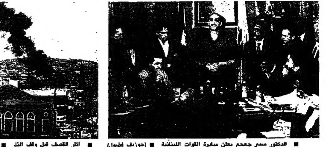
المختار سمع جعجع يعلن مغفرة القوات اللبنانية (جوزيف فضول)

مع اقتراب موعد لقاء المسؤولين السوريين مع رؤساء الطوائف والسياسيين المسلمين في لبنان تتجه الانتظار منذ ظهر أمس الاثنين الى دمشق. ورغم أنه لم تكن هناك تسمية رسمية لقاء المشور، فهناك من يقول إن اللقاء قد يصبح مؤتمرا اسلاميا لبنانيا برعاية سورية. وفندق الشيراتون، في دمشق الذي حجزت معظم غرفه للوفود المشاركة الى جانب عدد كبير من رجال الاعلام اللبنانيين، شهد الليلة الماضية لقاءات جانبية بين الوافدين الى العاصمة السورية. رئيس مجلس النواب السيد حسين الصبيحي وصل الى دمشق في الثالثة والنصف بعد الظهر، كما وصل الوزيران نبيه بري ووليد جنبلاط ونائب صيدا الدكتور نزيه البرزي والسيد عاصم القنصو والسيد عبد الأمير قبان والسيد محمد حسن الأمين في ما ينتظر وصول عدد آخر من المدعوين ومن بينهم مسلحة اللبناني حسن خالد والرئيس رشيد كرامي قتيبي الدين الصلح رشيد الصلح سليم الحص وعادل عسيران وغيرهم... وقبل ان عقد اللقاء الأول صباح اليوم الثلاثاء. ومن المنتظر ان يبدأ اللقاء الأول في الساعة العاشرة من قبل ظهر اليوم في مكتب نائب الرئيس السوري السيد عبد الحليم خدام. وضمن سلسلة اللقاءات الجانبية التي تمت الليلة الماضية في دمشق فقد غامر الرئيس الصبيحي فسق والشيرتون، في السابعة والنصف وقبل